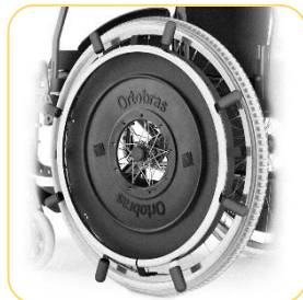
Aro para tetraplégico