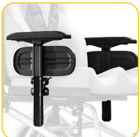
Braço elevável e removível