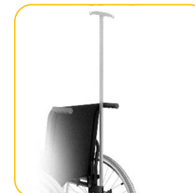
Suporte de soro