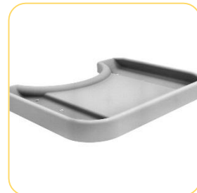
Mesa de atividades