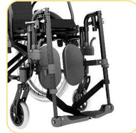
Pedal elevável e removível