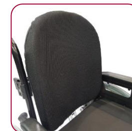
Encosto rígido ajustável