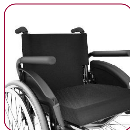
Apoio de braço tubular