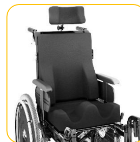
Assento e encosto anatômico