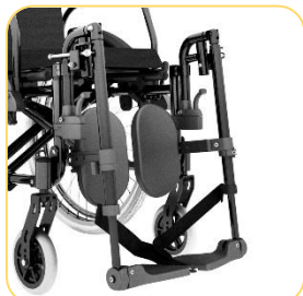
Pedal elevável e removível