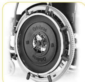
Aro para tetraplégico