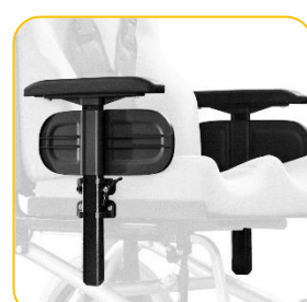
Braço elevável e removível