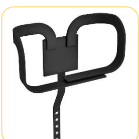
Cinto abdutor em "Y"