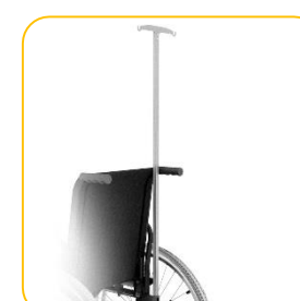
Suporte de soro