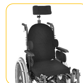
Apoio de cabeça