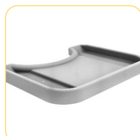
Mesa de atividades