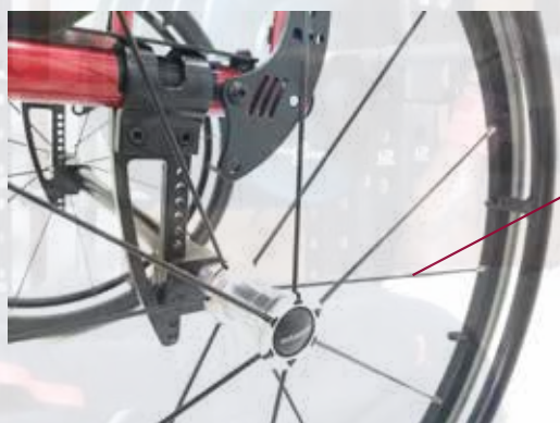
Rodas Sentinel de 12 raios de titânio.

A procura de novos materiais e tecnologias foram a chave no desenvolvimento da M3. O material dos raios das rodas traseiras é de titânio, e por utilizar poucos raios torna a roda 1Kg mais leve que as tradicionais de 36 raios de aço. Os raios são extremamente tensionados, o que torna a roda super leve e resistente.