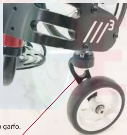
Desenho inovador do garfo. Moderno e com uma grande resistência.