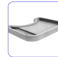
Mesa de atividades