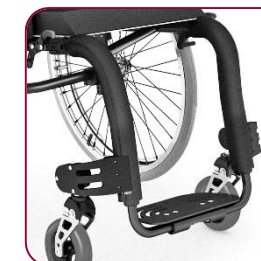
Protetor de quadro